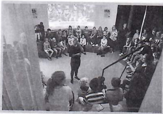
Debat NEST Den Haag